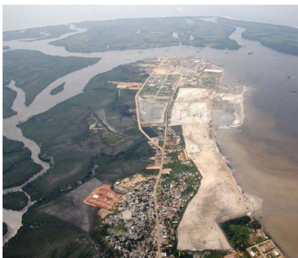
Промышленный центр на намывном песке Полуостров Сойо-Кванда (Ангола)