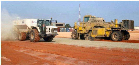
Внесение и смешивание компонентов Consolid