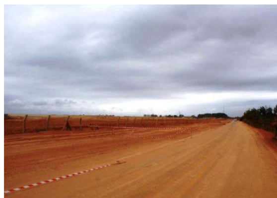
Готовый несущий слой