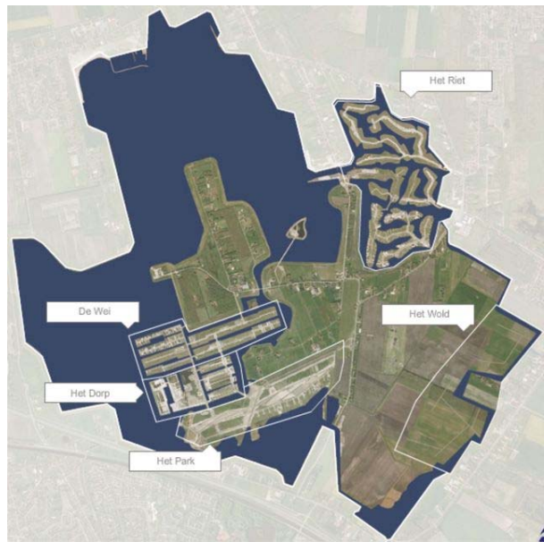
Разбивка города на различные территории