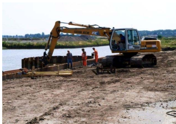
Строительство водоёма с CONSOLID