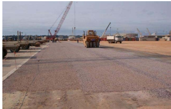
Заключительный слой наносится на слой Consolid