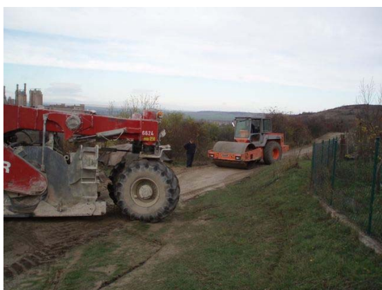
Проселочная дорога Karsdorf (Германия)