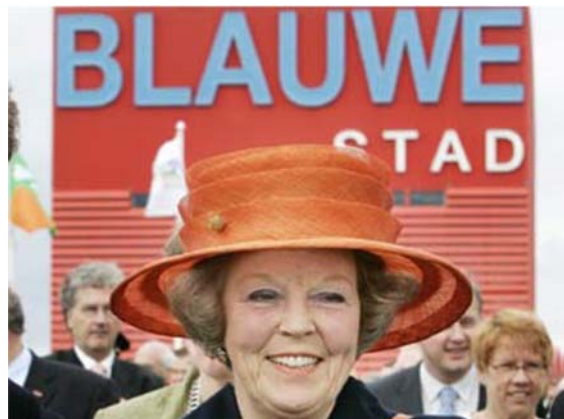
Открытие города Blauwe в Ноябре 2008