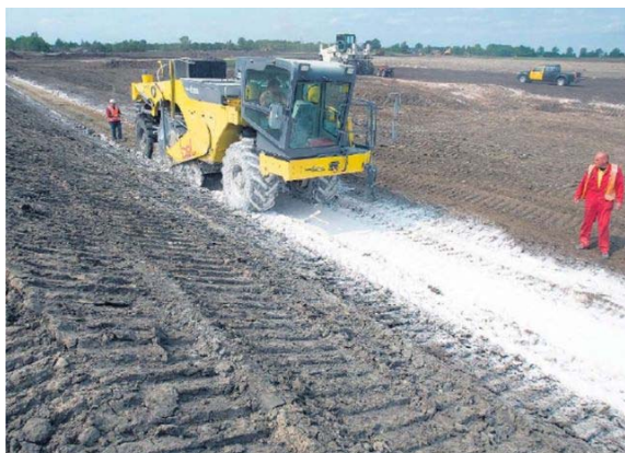
Внесение и смешивание компонентов CONSOLID