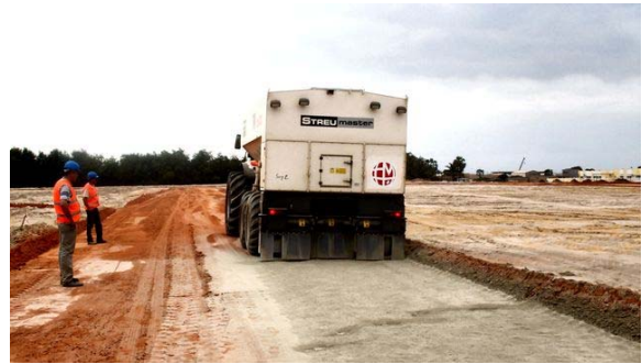
Внесение компонентов Consolid