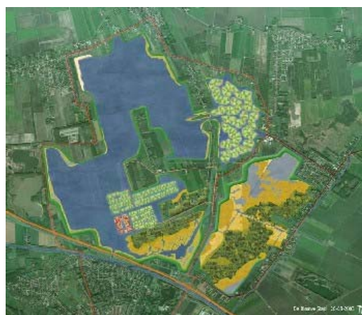
Герметизация каналов, проселочная дорога в Winschoten (Голландия) Проект „De blauwe Stad“