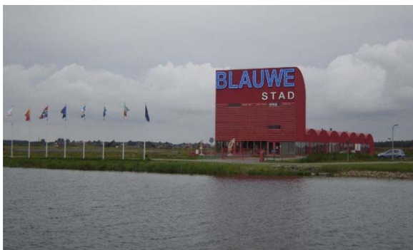
Информационный центр города Blauwe