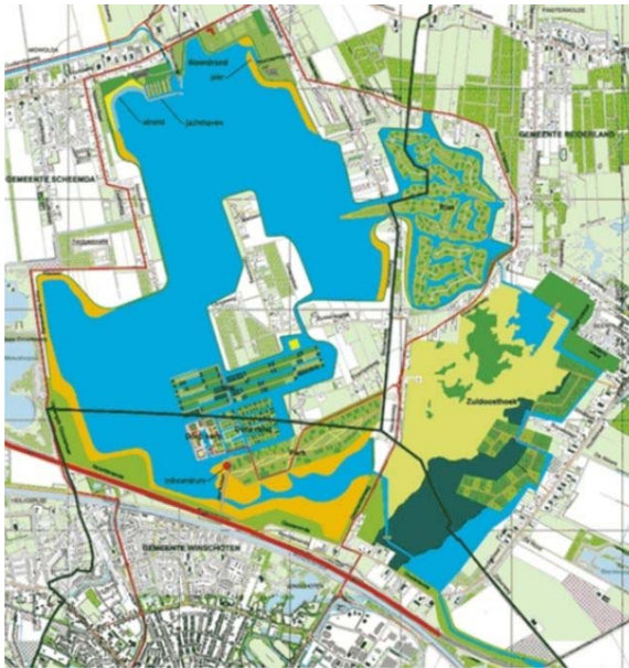
Площади города Blauwe около 1,5 x 1,5 км